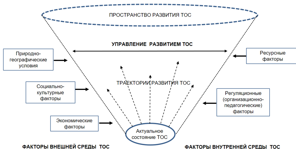
Рисунок 1 - Основные категории, характеризующие пространство развития территориальных образовательных систем

Так как территориальная образовательная система, являясь системой социальной, характеризуется развитием как одной из своих ключевых черт. Развитие ТОС отличается непрерывностью и нелинейностью. В рамках диссертационного исследования для описания данных процессов введена метакатегория «пространство развития» . Она объединяет актуальное состояние системы в данный момент времени и ее прогнозируемое состояние в обозримом будущем с учетом динамично меняющейся среды, как видно на рис. 1. Границы пространства задаются как внутренними факторами, так и ограничениями внешней среды. Таким образом, пространство развития представляет «поле» для трансформации системы из одного состояния в другое через изменение ее свойств. Многообразие возможных направлений движения в пределах пространства, оформленные в программах и управленческих решениях, конкретизируются другой метакатегорией – «траектории развития» .