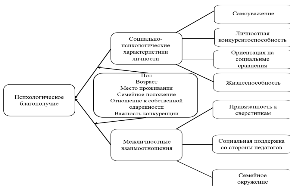
Рисунок 1. Социально-психологические факторы психологического благополучия китайских подростков с признаками академической одаренности (теоретическая модель)

ориентация на социальные сравнения, жизнеспособность и отношения с другими людьми (со сверстниками, педагогами, родителями) являются факторами психологического благополучия китайских подростков с признаками академической одаренности, а пол, возраст, место проживания (в образовательном учреждении интернатного типа/дома), семейное положение (отсутствие/наличие братьев/сестер), отношение к собственной одаренности и важность конкуренции могут быть потенциальными медиаторами, опосредующими влияние данных факторов на психологическое благополучие китайских подростков с признаками академической одаренности. Эти предположения легли в основу теоретической модели исследования (рис. 1).