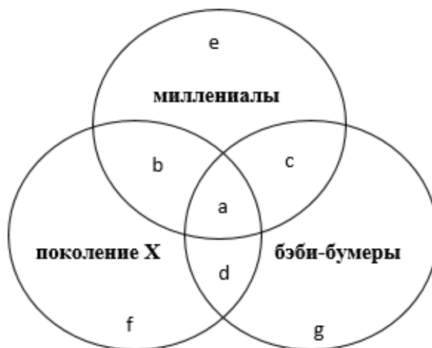
Рисунок 3. Сопоставление ядер социальных представлений разных поколений.

В параграфе 3.4 «Результаты опроса трех поколений о брачном партнере и романтических отношениях» приведены результаты заключительного этапа исследования. Выявлены элементы ядра социальных представлений трех поколений (рис. 3).