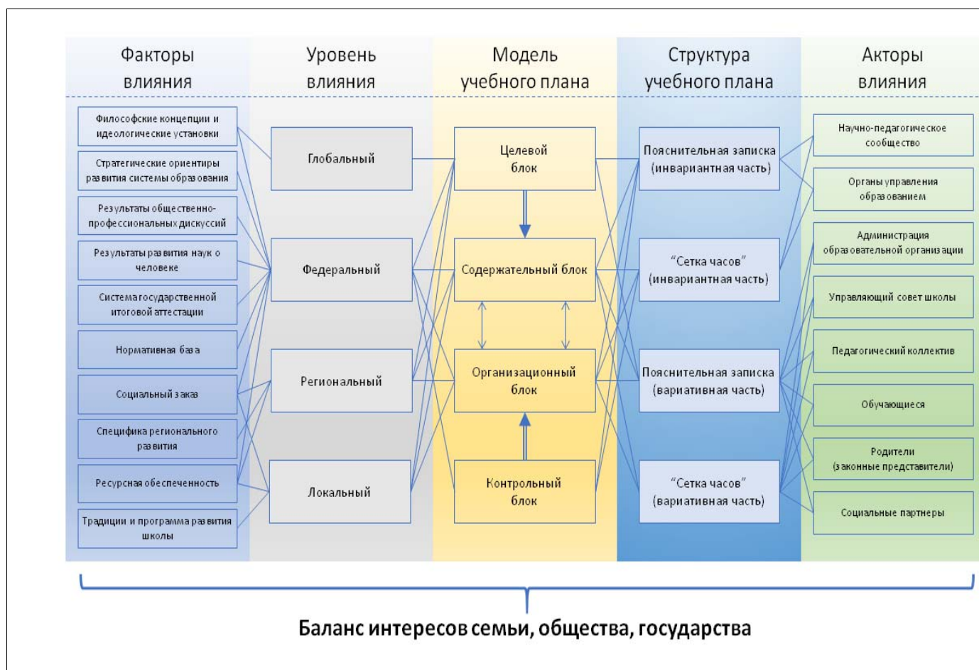
Рисунок 2 – Теоретическая модель школьного учебного плана

Выделение качественных характеристик и функций учебного плана, описание его структуры и связей с содержанием образования стало теоретической основой разработки концептуальной теоретической модели школьного учебного плана (рисунок 2), в которой выделены и охарактеризованы структурные элементы модели – целевой, содержательный, организационный, контрольный блоки; ведущая роль принадлежит целевому блоку. Все блоки соединены связями подчинения или соподчинения, между блоками осуществляется обратная связь. Блоки модели сопоставлены с внешними факторами влияния, выявленными в первой главе диссертационного исследования; с акторами процесса трансформации учебных планов.