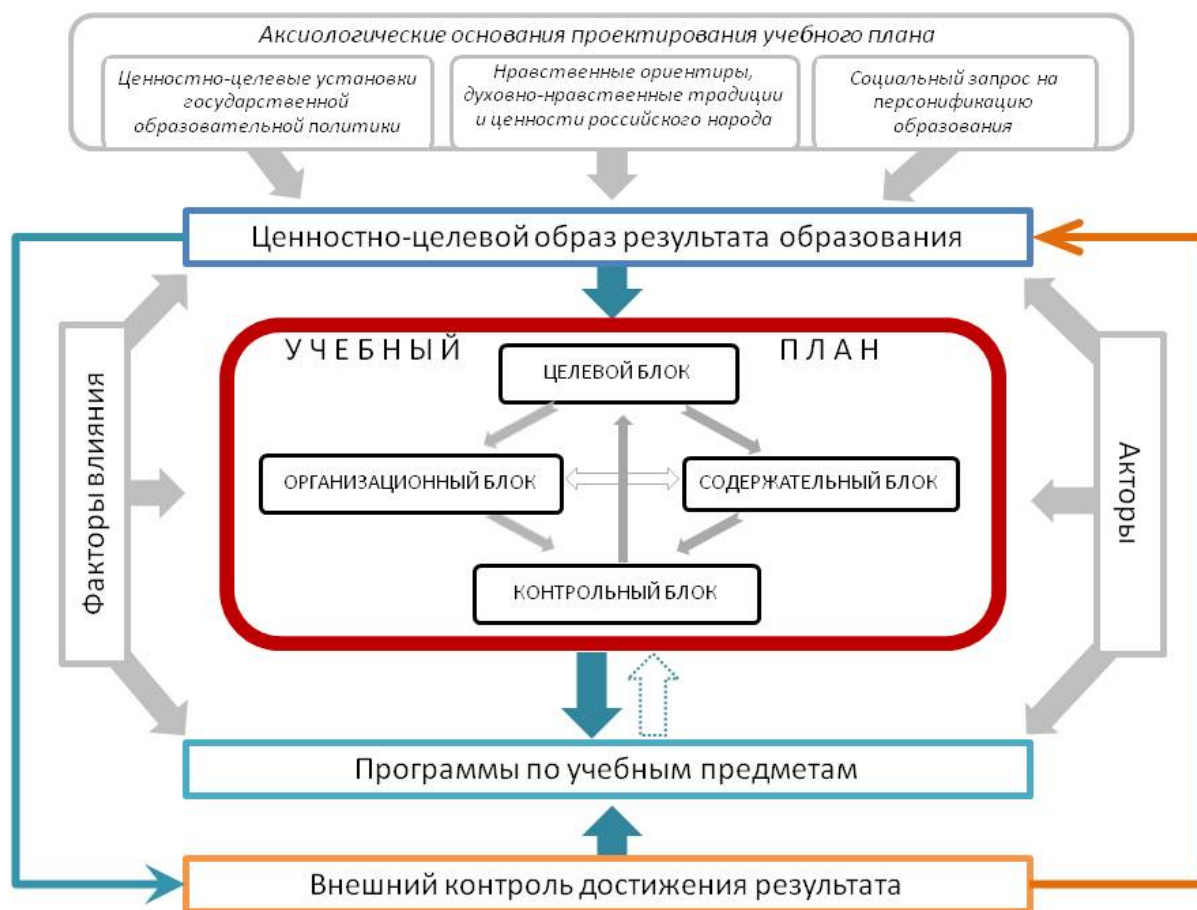
Рисунок 3 – Принципиальная схема проектирования школьных учебных планов

Изучение трансформации школьных учебных планов позволило сделать вывод о том, что консенсус относительно ценностно-целевого образа результата образования, состава учебных предметов в учебном плане, соотношения и содержания его инвариантной и вариативной частей достигается на основе согласования интересов государства, общества, личности с опорой на междисциплинарное психолого-педагогическое знание и представлений об образованном человеке.