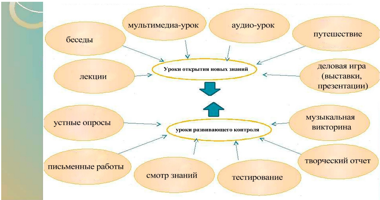
Рисунок 1. Типы и виды уроков интенсивного спецкурса «Этномузыка и танцы Китая»

Определяющей функцией первого этапа стало педагогическое управление процессом музыкально-эстетического воспитания подростков в художественной студии школы.