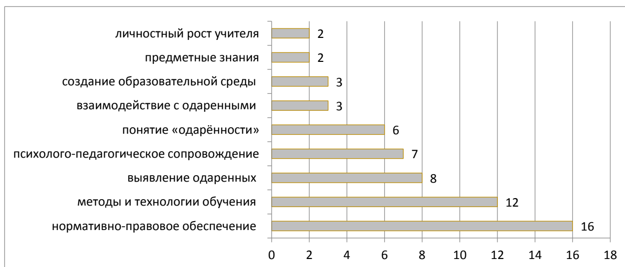
Рис. 3. Распределение программ ПК, направленных на подготовку педагогов к работе с одаренными детьми, по целям

Проанализировав имеющиеся курсы повышения квалификации, можно сделать вывод, что очень малое количество из них могут быть полезны в работе с одаренными детьми. Их всех представленных курсов можно выделить 121 программу, которая подходит для работы с одаренными. Эти программы, в основном, направлены на более глубокую проработку предмета (в том числе в условиях ФГОС), на инновационные подходы к изложению предмета. То есть, полученные на курсах знания можно использовать и для работы с одаренными детьми, и для работы со всеми учащимися. Есть также программы, направленные на изучение общих представлений об одаренности. Именно они представляют интерес в рамках данного исследования. Таких программ на сегодняшний день лишь 30. Таким образом, из всех представленных программ повышения квалификации учителей 0,24% могут быть использованы при работе с одаренными и 0,06% направлены непосредственно на изучение одаренности и особенности работы с одаренными детьми. Распределение программ по целям их реализации представлены на рисунке 3.